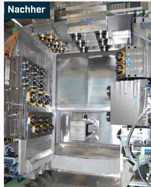
Fertigungsmodul FM 4+X vor und nach einer Überholung